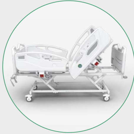
Inclinación del Espaldar