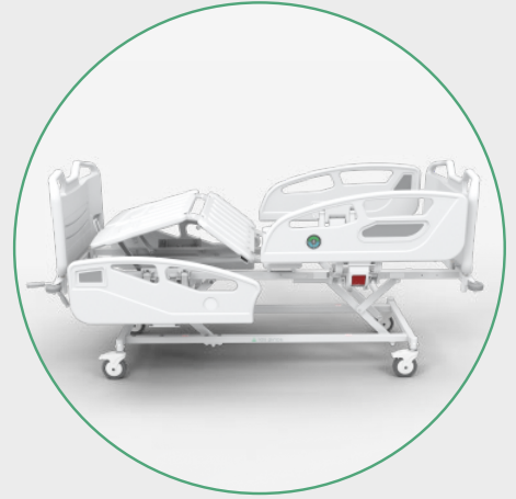
Inclinación del Piecero