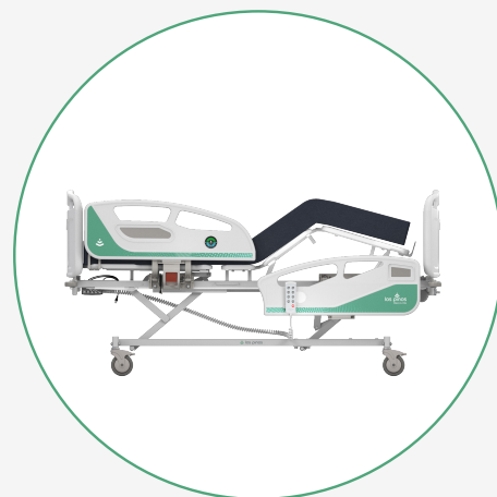
Inclinación del Piecero

Nuestro sistema de compensación abdominal, separa el plano espaldar y el plano piecero del plano fijo para disminuir la presión en la zona lumbar y prevenir úlceras en la piel.