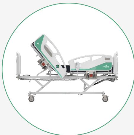
Inclinación del Espaldar