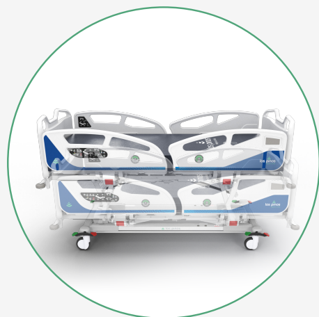
Horizontal y Cambio de Altura