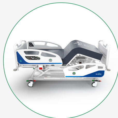
Inclinación del Piecero