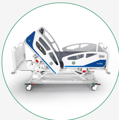
Inclinación del Espaldar