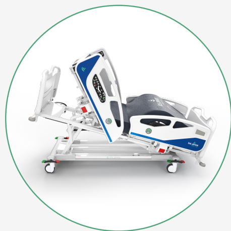
Posición Vascular y Silla Cardíaca