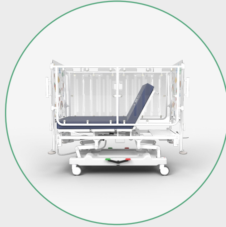
Inclinación del Espaldar