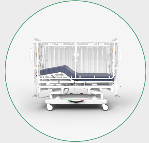
Inclinación del Piecero