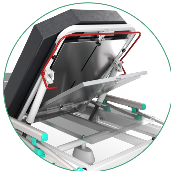
Porta Chasis para Rayos X