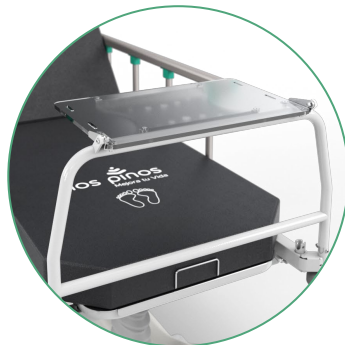
Mesa Porta Monitor