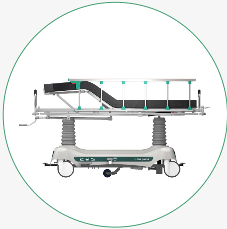
Inclinación de Pies