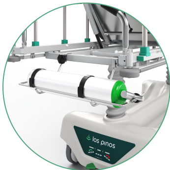
Soporte Porta Oxígeno

Con el fin de aumentar la usabilidad de la camilla, hemos diseñado los siguientes accesorios opcionales.