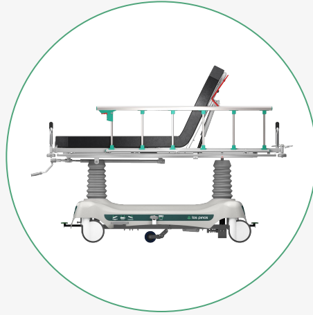
Inclinación del Espaldar