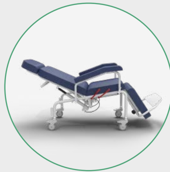
Inclinación del Espaldar