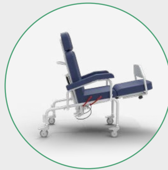
Inclinación del Piecero