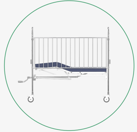
Inclinación del Piecero